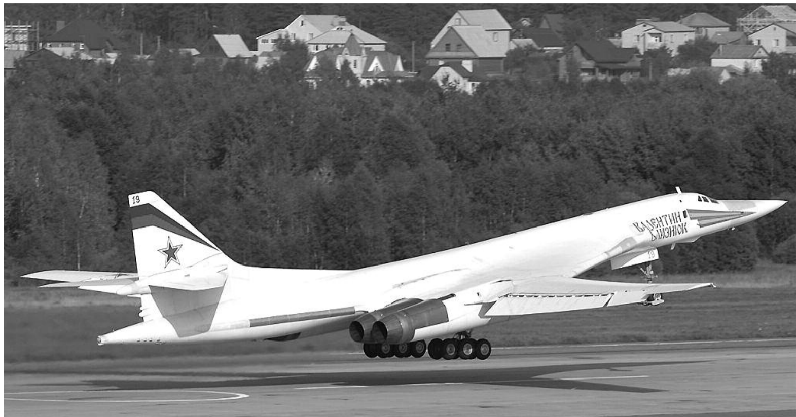
● НА ФОТО: СЕЙЧАС НА ВООРУЖЕНИИ ВВС РОССИИ НАХОДЯТСЯ ТОЛЬКО 13 СТРАТЕГИЧЕСКИХ БОМБАРДИРОВЩИКОВ ТУ-160 И 63 БОМБАРДИРОВЩИКА ТУ-95МС

С 1994 г. поступление новой техники в войска ПВО прекратилось и до 2007 г. не возобновлялось. ПВО давно носит очаговый характер, обеспечивая прикрытие лишь некоторых наиболее важных объектов. В ней зияют «дыры», самая большая из которых между Хабаровском и Иркутском (около 3 400 км). Россия открыта со стороны Северного Ледовитого океана.