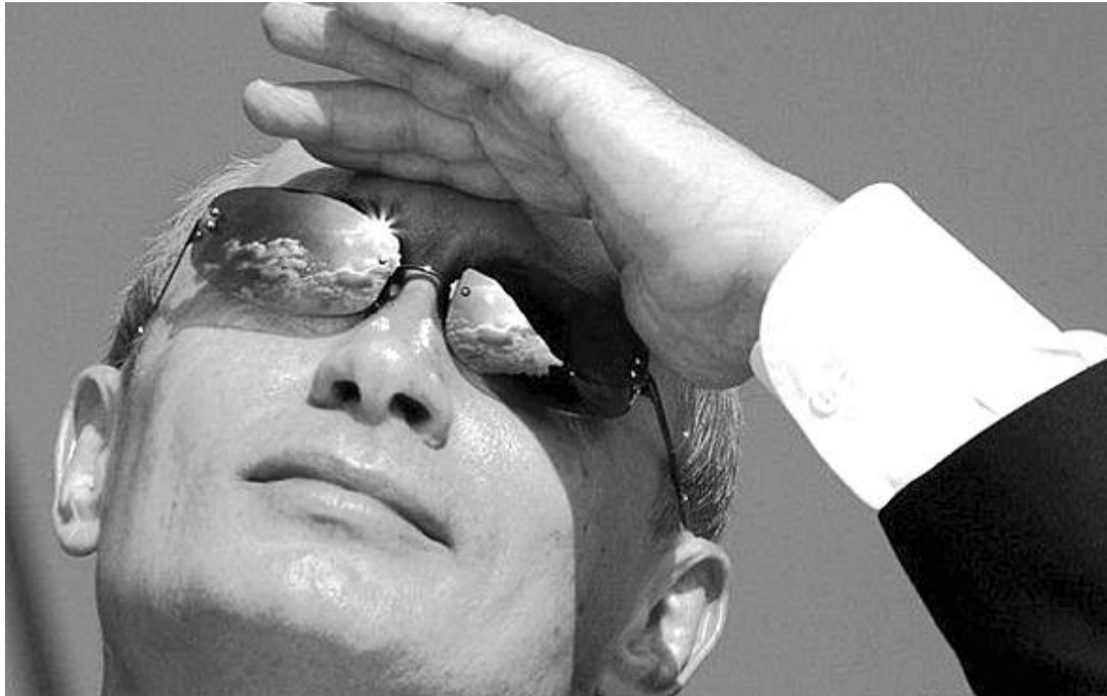
● НА ФОТО: В. ПУТИН — ЧЕЛОВЕК МАЛОНРАВСТВЕННЫЙ И КОРЫСТНЫЙ, ЗАЩИЩАЮЩИЙ ИНТЕРЕСЫ ОЛИГАРХОВ

Находясь в 1998-99 годах во главе ФСБ России, он расформировал управления экономической контрразведки и контрразведывательного обеспечения стратегических