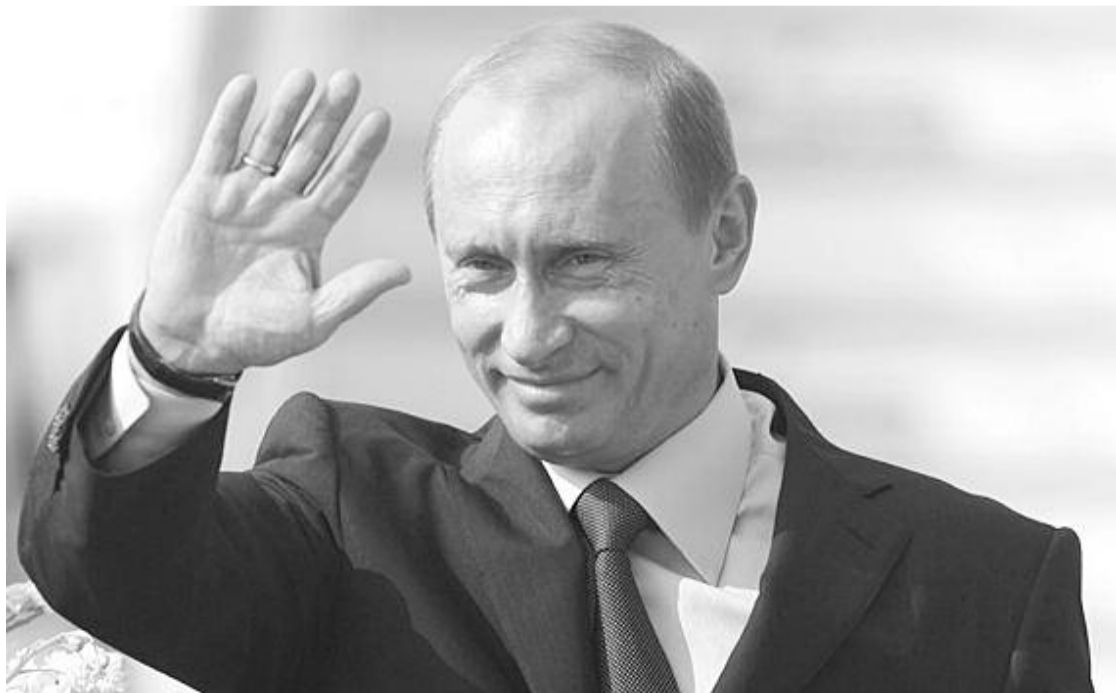
● НА ФОТО: ОБВИНЕНИЕ СЧИТАЕТ НЕОБХОДИМЫМ ЗАЯВИТЬ О НЕВОЗМОЖНОСТИ ДАЛЬНЕЙШЕГО НАХОЖДЕНИЯ В. ПУТИНА НА ГОСУДАРСТВЕННОЙ СЛУЖБЕ

« Военно-промышленный комплекс подвергся жесточайшему расчленению и приватизации, искусственному банкротству и распродаже за бесценок, в том числе и зарубежным фирмам »