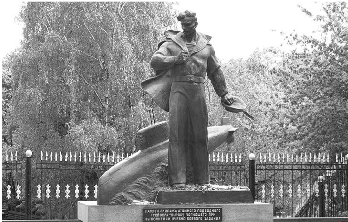
● НА ФОТО: ВХОЖДЕНИЕ В. ПУТИНА НА ПОСТ ГЛАВЫ ГОСУДАРСТВА ОЗНАМЕНОВАЛОСЬ ГИБЕЛЬЮ АПК «КУРСК»

Еще хуже обстоят дела в морской ядерной триаде. В 1991 году России от СССР перешло 55 атомных подводных лодок стратегического назначения, и все они к 2015 году будут сняты с боевого дежурства.